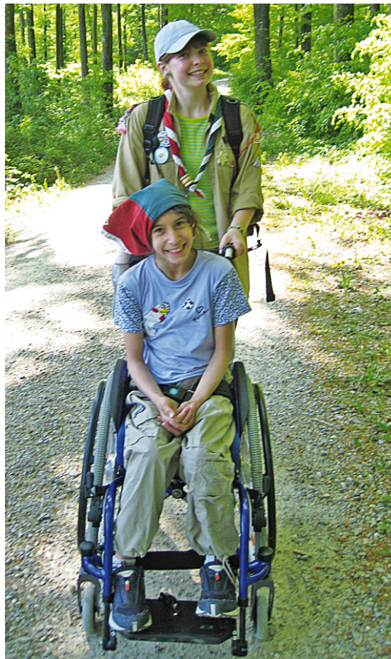
... und weiterhin mit behinderten Kindern Pfadi machen. Bei der PTA – Pfadi trotz allem.

Weitere Informationen: www.ptaatlantis.ch